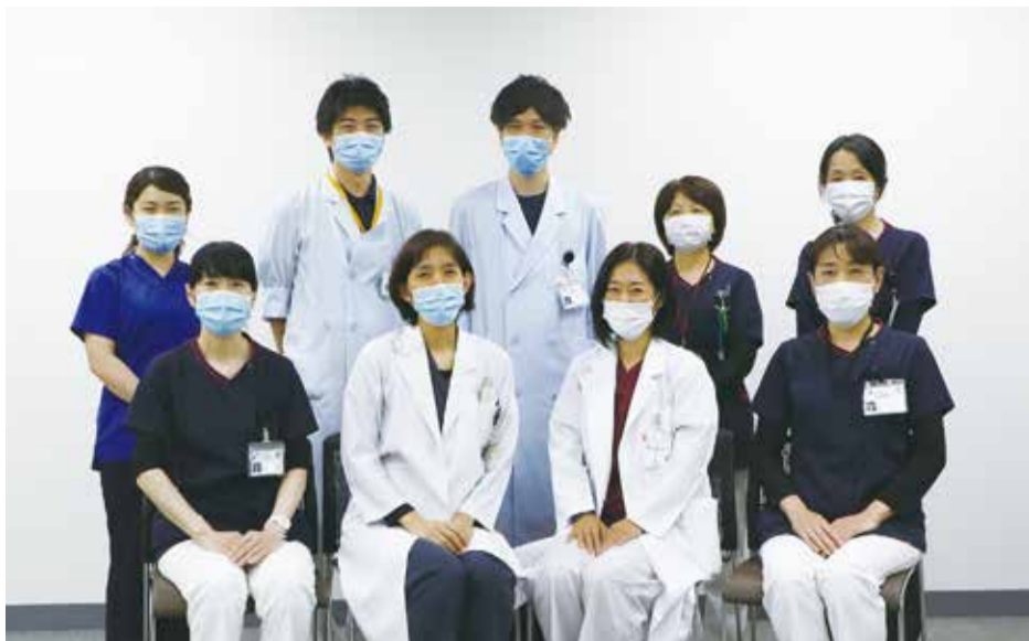
医師、看護師のほか多職種による緩和ケアチームメンバー

「今は、がんの告知段階から緩和医療が関わることで、世界的なスタンダードになってきています。現在の緩和ケアは、決して患者さんの最期を前提とした医療ではありません。緩和ケアチームが関わるようになったことで、痛みや吐き気などがんによる症状が改善し、がんの積極的治療が開始できたケースもあります」