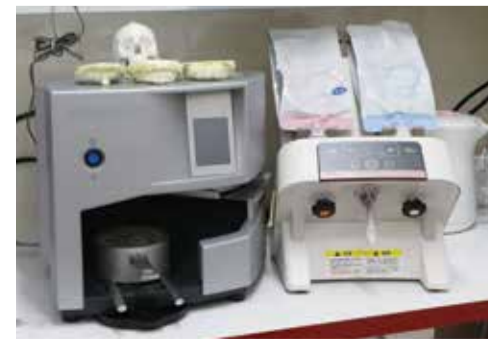
患者さんに合わせたマウスピースをつくる機器

これらのケアを行うことで、手術後にもしっかりと食事が取れ、早期回復につながることを目指しています。おいしく食事ができないと楽しみがひとつ減りますよね。 患者さんに合わせたマウスピースをつくる機器