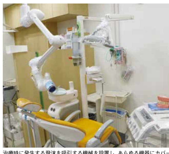
治療時に発生する飛沫を吸引する機械を設置し、あらゆる機器にカバーをかけ、患者さん一人ずつ交換します

全を期しています。スタッフの防護服はもちろん、お口に入る器具は消毒、滅菌し、すべての機材にもビニールのカバーをかけ、患者さん一人ずつ交換しています。一人の診察にかかる時間は1.5倍から2倍になりますが、感染者を出さないようにするためには必要な措置です。