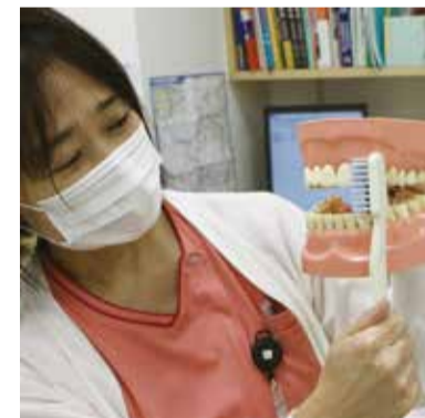
歯科衛生士がセルフケアを指導します

歯科衛生士 本院では糖尿病教育入院の1項目として、歯周病検査やお口のセルフケア指導を行っています。歯周病が悪化するとインシュリンの働きが悪くなるTNF- \alpha という物質が出ます。さらに、歯も抜けて、血糖値が上がったりやわらかい食べ物しか食べられなくなってしまう。このような糖尿病の悪化と口腔機能低下を起さないように、歯周病管理を行っています。