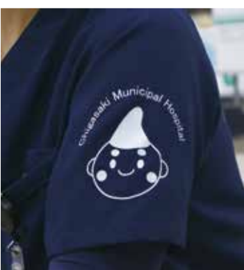
リラックスして診察を受けてもらえるよう制服の袖にはえぼし麻呂がいます

私たちは一人ひとりの患者さんに寄り添う医療を志すことはもちろんですが、地域の医療従事者のみなさんに連携をお願いし、茅ヶ崎の医療を支える一員になれるよう日々努力していきたいと思えます。