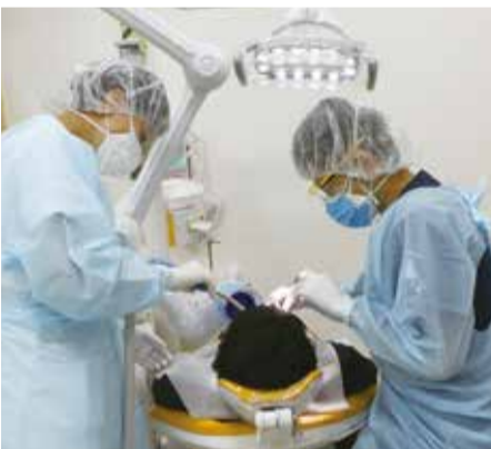
感染症対策を施し行う診察の様子

医師 お口の中の診察をするので、唾液のエアロゾルが飛びやすい環境であることは間違いないです。その中でウイルスに感染しない、させない対策は万