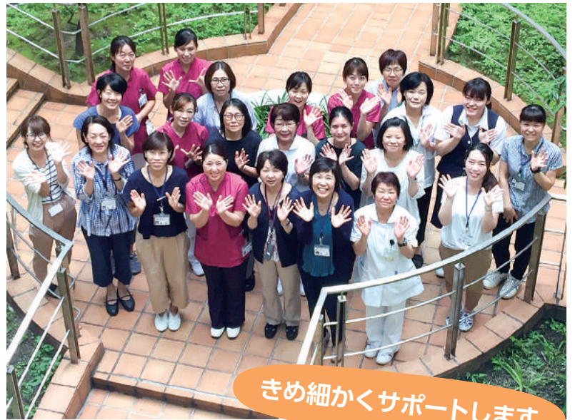
きめ細かくサポートします

患者支援センターでは、患者さんやご家族の不安や悩みを相談できる体制を整えています。ささいなことでも一人で悩まず、お立ち寄りください。