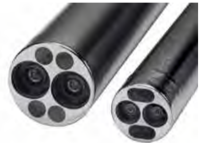
術野を立体的映像でとらえる3Dカメラ。患部をさまざまな角度からとらえることができます

内視鏡カメラがとらえた3次元画像は、これまで不可能といわれてきた角度まで広く鮮明に映すことが可能で、実際の術野を見ているのに近い感覚での手技を可能にすると言われています。ロボットを操作する執刀医は、最大約10倍以上の拡大視野で立体的に術野をとらえることができるので、緻密な手術操作や正確性の向上が期待できます。