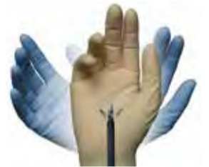
インストゥルメントは体腔内で柔軟に操作できるように関節を備えているので、人の手よりもむしろ広範囲に自然に稼働します