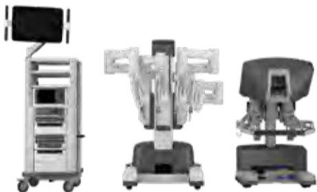
左からビジョンカート、ペイシェントカート、サージョンコンソール

ダヴィンチは「サージョンコンソール」「ペイシェントカート」「ビジョンカート」の3つの装置で構成されています。「サージョンコンソール」は執刀医の操縦台で、モニターに映る3Dの拡大画像で術野を見ながら、患者に直接触れることなく手元のハンドルを操作して、「ペイシェントカート」のロボットアームに取り付けたロボット鉗子を自在に操り手術をします。「ビジョンカート」は執刀医の見ている映像と同じ映像を映し出し、スタッフが手術の過程を共有します。