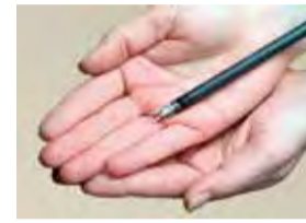
インストゥルメントと呼ばれる鉗子類はとても小さく、術者のコントローラーの動きに連動して正確に動きます

執刀医が操作するアームの先端には直径8mmほどのシャフトが備わり、その先の3Dカメラや鉗子類が患者さんの体内に入ります。鉗子は人間の手首以上に広い可動域を持ち、執刀医の意図しない微妙な手の動きや震えを伝えない手ぶれ補正機能もついています。鉗子にはつまむ、はがす、切る、縫うなど役割によって多くの種類が用意されており、まるで指先のように細やかな動きで細かい手技を再現します。