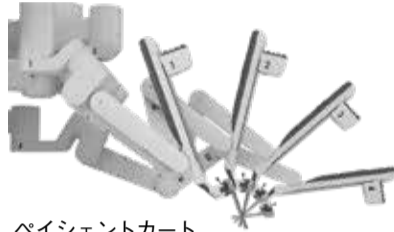
ペイシェントカートから伸びるアームの様子

茅ヶ崎市立病院に導入されたダヴィンチは低侵襲手術(患者さんの体への負担が少ない手術)を行う手術支援ロボットです。といっても、ロボットそのものが手術を行うわけではなく、執刀医がロボットアームをコントロールして、モニターに映る映像を見ながら手術するという手法で、ロボット技術により精密な動作が可能になることから、正確で負担の少ない手術が可能になると考えられています。ダヴィンチは1999年にアメリカFDA(食品医薬品局)の許可を受けて以降、普及が進み、現在世界での臨床実績は年間約150万症例。この手術を受けた患者さんも延べ1,000万人を超えています。(2022年1月現在)